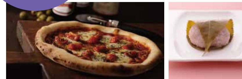
ピザ、桜餅もご試食していただけます！